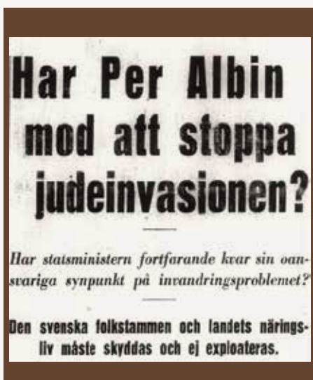
Rubrik i SNF:s partiorgan Nationell Tidning 1935.

"Rasfrågan" är och förblir central: "I nära samband med befolkningsfrågan stå frågorna om rashygien och immigration. Det finnes enligt vår uppfattning ingen anledning att på grund av avskräckande exempel utomlands förneka vårt behov av en sund raspolitik. Det gäller för oss t. ex. att komma till rätta med frågan om mindervärdiga elements fortplantning, som framförallt gör sig påmint i våra sinnessjukhus och på våra sinnesslöanstalter. Det övervägande flertalet yngre svenskar – och vi utgöra intet undantag – anse vidare vårt folks enhetliga sammansättning vara ett oförytterligt värde. Försök att i större antal placera judiska flyktingar som yrkesutövare i vårt land ha vållat stark irritation och skulle även i