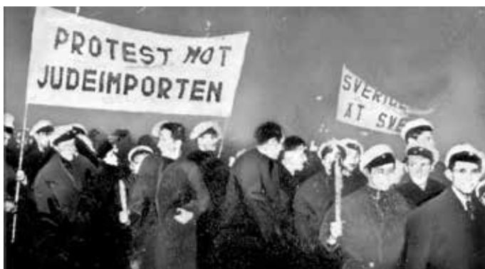
Protestmöte på Östermalmstorg i Stockholm i februari 1939, arrangerat av nazistiska SSS.

Judefråga. Judeimport. Det är slående hur förled och efterled här får förstärka varandra. Frågan är oroande därför att den gäller judar. Judarna är ett bekymmer därför att de kommer att bli en ”fråga”. Importen, ett i olika varianter återkommande nyckelbegrepp i kampanjjournalistiken vintern 1939, är farlig därför att den gäller judarna. Judarna framstår som hotfulla därför att de ska ”importeras”, lastrum efter lastrum kan man föreställa sig. Så sandpapprades det denna vinter också den svenska civilisatoriska fernissan. Så tog också Sverige ett litet steg på vägen mot barbari, ett