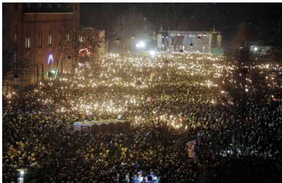
Uppemot 40 000 samlades i Köpenhamn för att hedra terrorns offer.