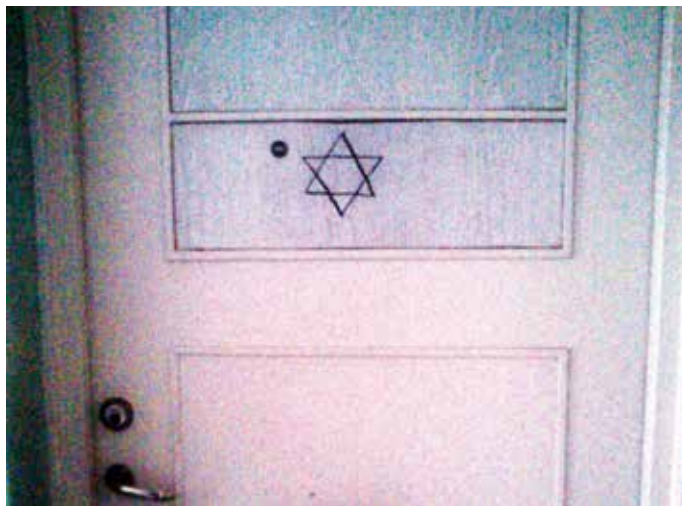
Judar trakasseras: Davidsstjärna ritad på lägenhetsdörr i Malmö.

Man blir utpekad som skyldig. "Varför skjuter DU raketer?" Och så hör man på radio att det är klart att dom inte tycker om judar här i Sverige för dom mördar ju deras familjer i Mellanöstern. Då blir jag så himla förbannad. För vad har vi, jag är 16 år