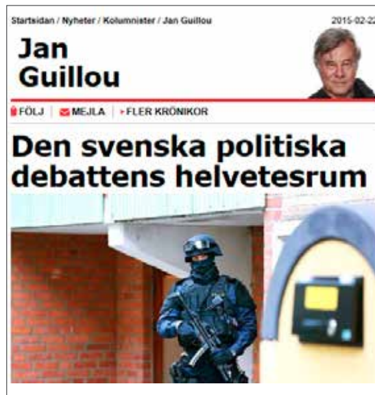
Jan Guillous kolumn i Aftonbladet.

GUILLOU HAR OCKSÅ sedan länge stått i förgrunden för den falska men inte ovanliga propaganda som gör gällande att antisemitismen inte bara utgör ett icke-problem utan också "ersatts" av muslimfientlighet. När en tydligare antijudisk strömning framträdde i Europa i början av 00-talet deklarerade han snabbt att "vår tids rasistiska sjuka inte gäller judar utan muslimer" (Aftonbladet 16/4 2001). Så har det fortsatt och så låter det även i Guillous senaste alster. Det finns ingen anledning att skydda synagogor och judiska