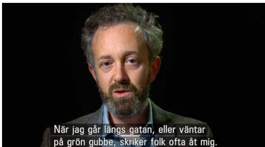
Vittnesmål om antisemitiska trakasserier. Skärmbild från Uppdrag granskning 21/1 2005.

ISRAEL UPPFATTAS SOM bekant inte som vilken stat som helst, utan är en som enligt många människor inte borde finnas. Den är också världens enda judiska stat. Många judar har en anknytning till Israel på ett eller annat sätt. Kanske genom att ha släktingar där, kanske då det är ett centrum för judisk kultur och religion, kanske helt enkelt bara genom vetskapen om att alltid vara välkommen att flytta dit om utanförskapet gentemot majoritetskulturen skulle börja bli tungt att bära.