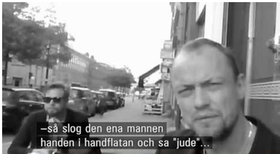
Skärmbild från Uppdrag granskning 21/1 2015.

Verbalt eller reellt våld mot judar handlar så sett om en frustration inför att vara makt-