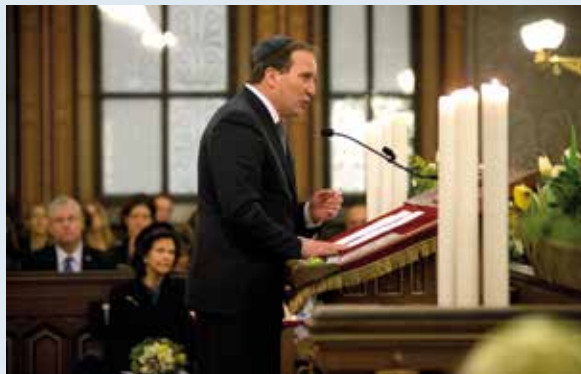
Statsminister Stefan Löfven i Stockholms stora synagoga 27/1 2015.

Det var en ära att delta i kippavandringen här i Stockholm i somras. Men jag känner samtidigt är det en skam för Sverige att kippavandringarnas markering ens behövs.