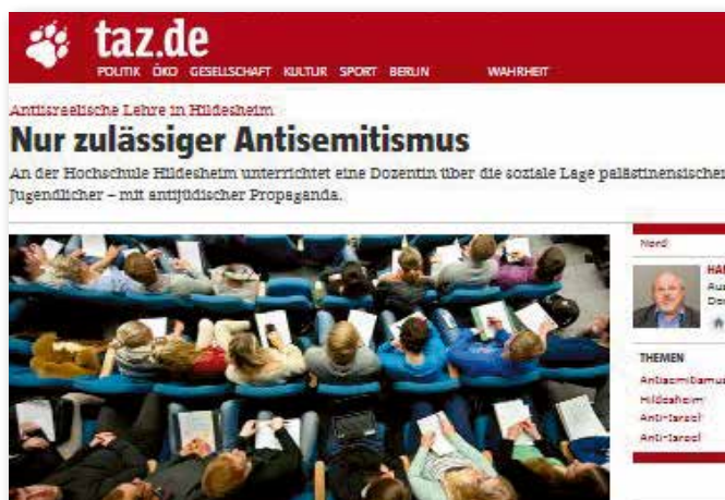
Dagstidningen TAZ skrev den 1/8 om "antijudisk propaganda" i undervisningen vid högskolan i Hildesheim.