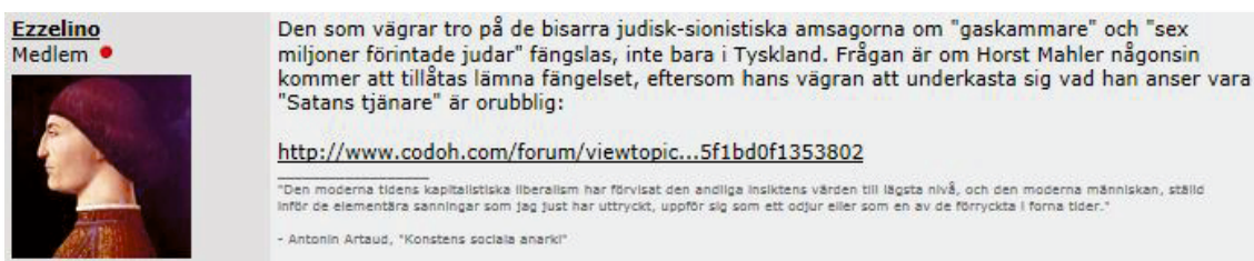
Inlägg av "Ezzelino" på Flashback (skärmbild).

Morfar, som Pyret beundrar djupt, håller monologer och delger Pyret sina fascistoida övertygelser – han hyser exempelvis ett beckmörkt kvinnohat – och kulturella preferenser. Han är mycket beläst och bevandrad i filosofi, litteratur, historia och religioner. Morfar är å ena sidan en skräpelig och motbjudande åldring, å andra sidan