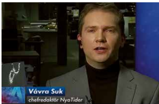
Nya tiders chefredaktör i Aktuellt (skärmbild).