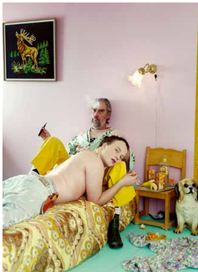
Från Turteaterns uppsättning av Åldreomsorgen i Övre Kågedalen .

FALLET EZZELINO-TERATOLOGEN STÄLLER oss inför många frågor. Om relationen mellan författare och text.