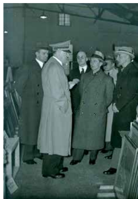
Hitler inspekterar konst som stulits av den nazistiska regimen.

Elva principer arbetades fram under konferensen, däribland att naziplundrad konst skulle identifieras och återlämnas, arkiv som berörde frågan skulle tillgängliggöras och nationella