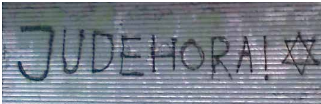
Antisemitisk klotter i en Stockholmsförort. (Bilden är från ett tidigare år.)

Enligt Brottsförebyggande rådets (Brå) nyligen publicerade rapport Hatbrott 2015 anmäldes under fjolåret runt 280 hatbrott med antisemitiska motiv. Det är det högsta antal som noterats, även om skillnaden i förhållande till nivån för 2014 är marginell.