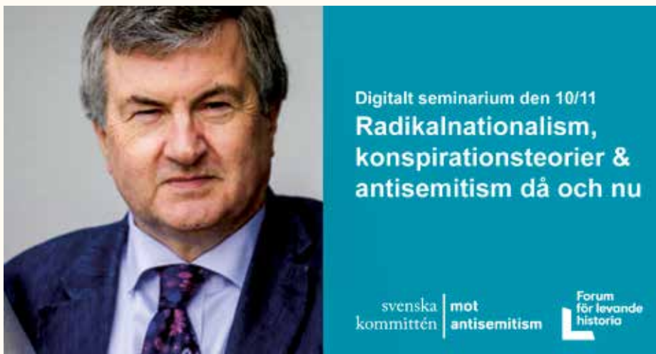
Historikern Richard J. Evans.

Under senare år har radikalnationalismen vunnit mark i Europa och USA. I allt fler länder utmanas demokratin och dess grundläggande värden. Vi ser också en ökad spridning av konspirationsteorier, inte sällan med antisemitiska och rasistiska förtecken. Vissa menar att utvecklingen påminner om vad som hände i Europa under mellankrigstiden. Men hur relevanta är jämförelser med 1930-talet för att förstå samtida skeenden? Det var en av frågorna som diskuterades på SKMA:s digitala seminarium den 10 november, i samband med minneshållandet av Novemberprogromen 1938.