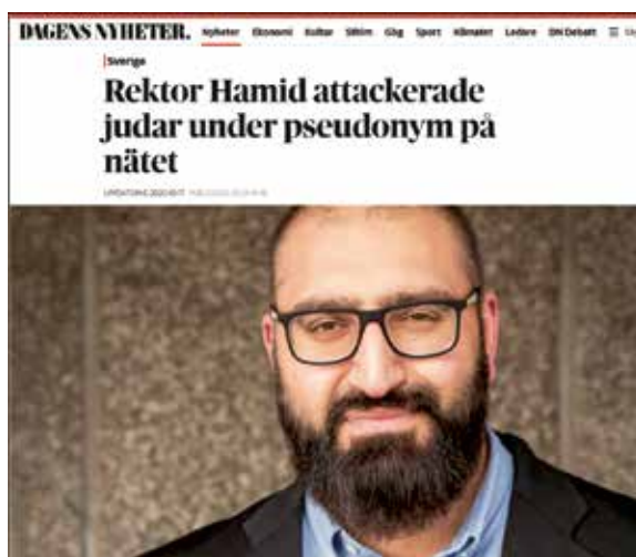
Skärmavbild från dn.se