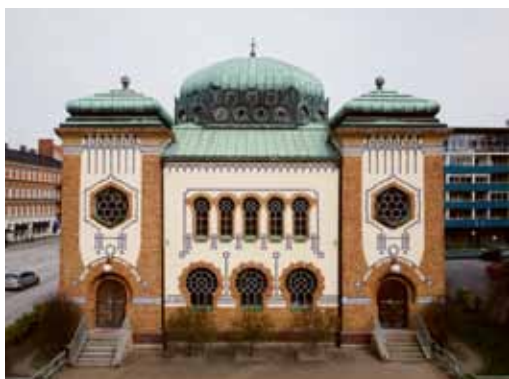
Judar på väg till eller ifrån synagogan i Malmö har utsatts för gläpord och hat.