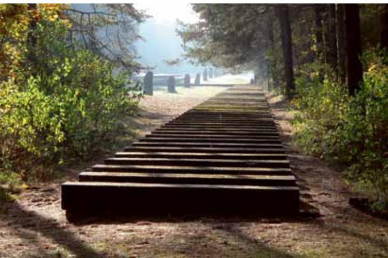
Minnesmonument vid platsen för förintelslägret Treblinka.