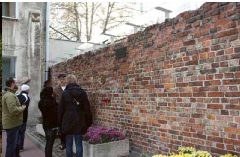
Besök vid resterna av gettomuren i Warszawa.

I Pojkarnas fickkalender 1941 har min då 15-årige far skrivit upp vilka filmer han sett. Det är korta noteringar. Fickkalendern innehåller också ett långt förtryckt kapitel om Scouterna och beredskapen. ”Gasmasken studeras” står det under en bild och under en annan ”Många scouter äro blodgivare”.