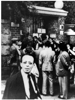
Kön till svenska ambassaden i Budapest.