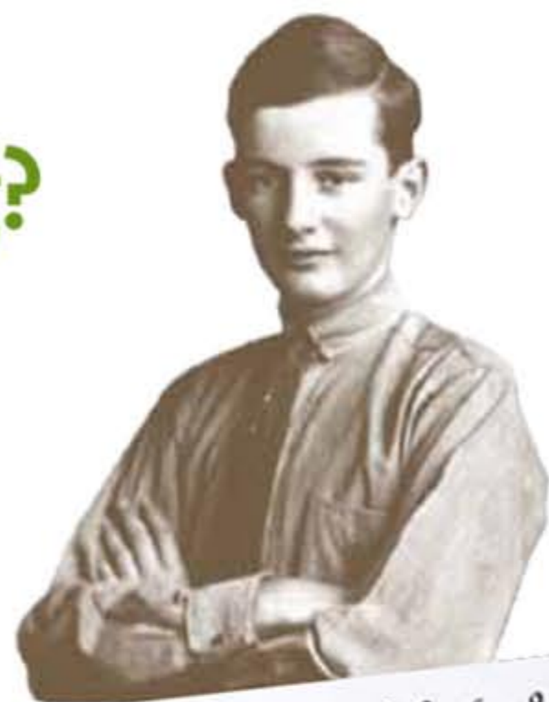
Raoul Wallenberg 12 år.