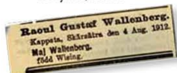
Raoul Wallenbergs födelseannons.