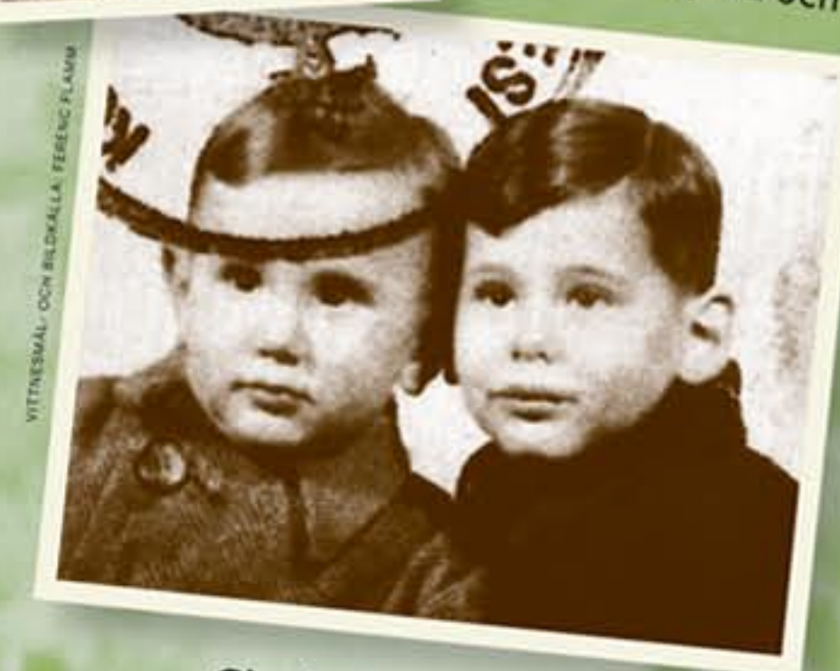
"Vi bodde i hus som stod under svenska ambassadens beskydd"