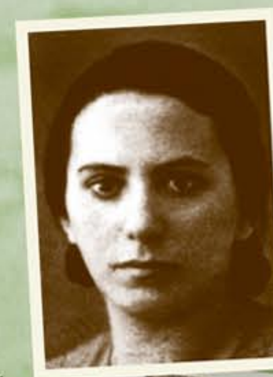
"Pappa, mamma och alla mina syskon lyckades få svenska skyddspass"