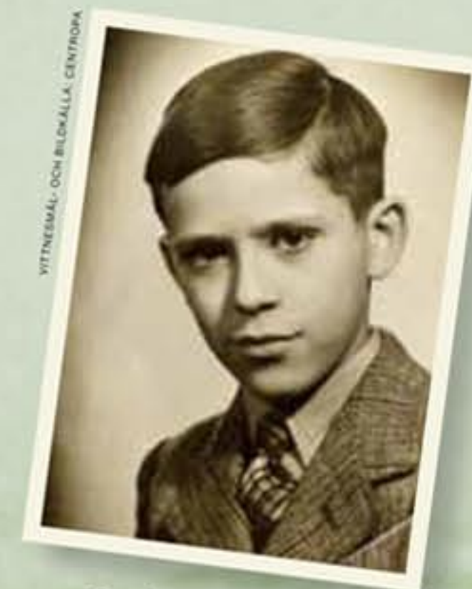
"Jag överlevde dödsskjutningarna vid floden"