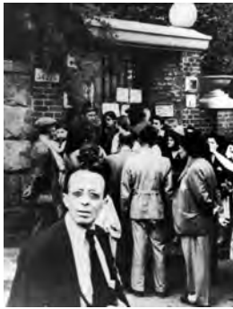
Kön till svenska ambassaden i Budapest.